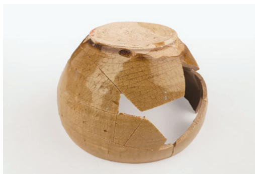
4. Di vật 2019ZWT3②:30