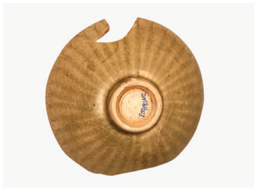
1. Di vật 18ZWH2:3