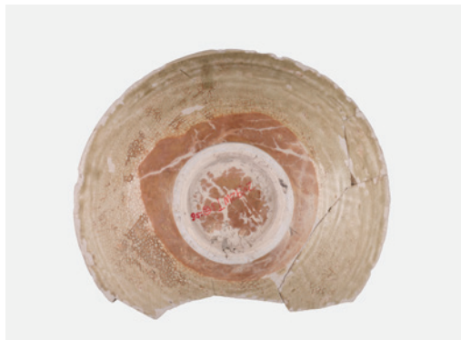
2. Di vật 2019ZWT3②:56