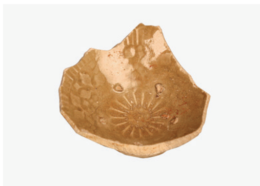
3. Di vật 18ZWC:31